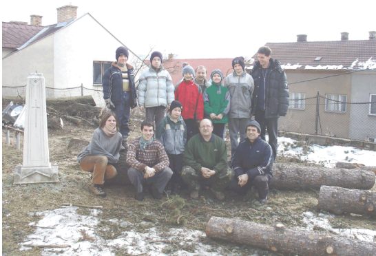
Kácení stromů u opěrné zdi

Ve dnech 21. - 26. srpna 2006 se uskuteční další ročník Pěší pouti na Velehrad z různých směrů. Informace: ŘKF Znojmo, sv. Mikuláš 515 224 694, ŘKF Vranov nad Dyjí 515 296 384 a cykloputnici 723 188 921.